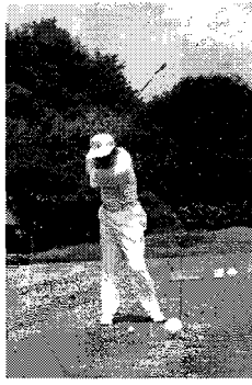
写真は、プレー中の筆者

ゴルフ歴だけはへボながら長く、「一度は行ってみたいゴルフ場百選」のうち80以上、全都道府県のゴルフ場でプレー。ホールインワンも三度経験。しかし近年は、奈落の底。オフィシャルハンディも10年間で8つ下落、ヒギナー並みに。