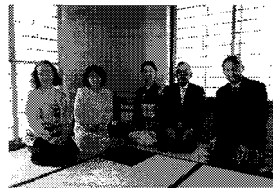
新年会を兼ねた「初釜」の席で