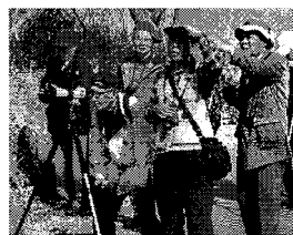
福生南公園付近での野鳥観察

3月9日午前8時30分、拝島駅に11名の会員が集合して開催。当日は、5月並みの暖かな晴天となり、絶好の観察日和だった。駅から15分ほど歩いて福生南公園に出て、多摩川左岸を下流に向かう。歩き始めてすぐに、浅瀬で餌を探すハシボソガラスの群れとダイサギが目に入った。