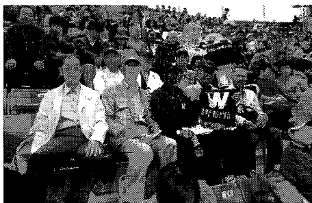
応援席で母校に声援(昨年秋の早慶戦)

学生スポーツで唯一天皇賜杯のある東京六大学野球、伝統の早慶戦では、幾多の名勝負が語り継がれています。私どもの年代では、1960年秋の6連戦。2勝1敗