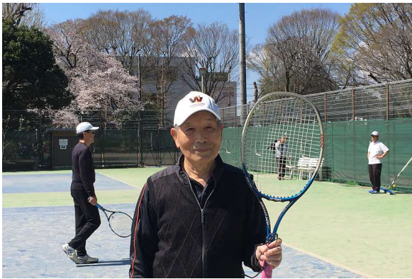
多摩平テニスコートにて

しかし、様々な制約のある中、オープンスペースである戸外同好会だけは、今までと違う活動形式でスタートを切ったらどうでしょう。同好会の連帯感が失われないよう、奮起して勇気をもって共に頑張ろうではありませんか。