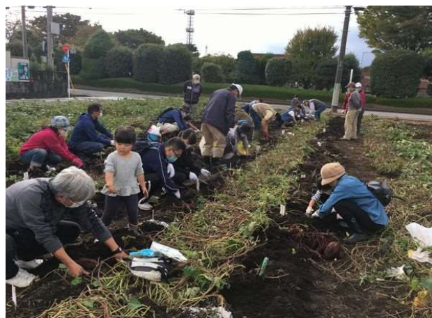
濃厚接触しないよう区画を空けての農耕作業