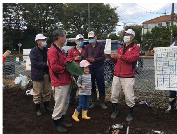
さつま芋の大きさ比べ表彰式：優勝 1690g(午前部)